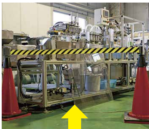
このようになっているケースが多い