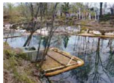
農業用溜池への油流出