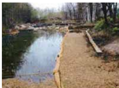
農業用溜池への油流出