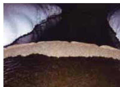
セルフフェンスと併用