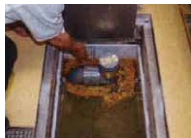
厨房内グリーストラップ