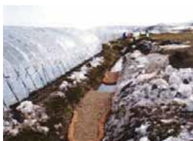
セルフフェンスと併用