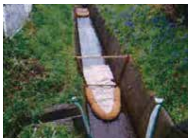
セルフフェンス/セルマットと併用