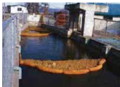
農業用水路への油流出