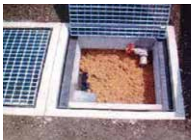
舗装プラント油水分離槽