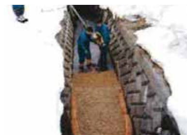
河川への油流出～冬期低温状態にも対応～