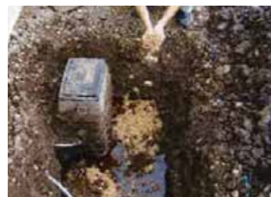
タンクからの灯油流出