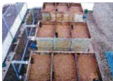
灯油流出事故現場油水分離槽