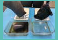
右が ECOSAS ファイバー

一度吸った油は、漏らすことなく24時間経過しても保持し続けます。作業の手間や時間を短縮できることで、労務改善にもつながります。